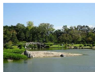
隣設 日本庭園 花田苑