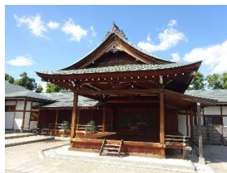
能楽堂で体験教室